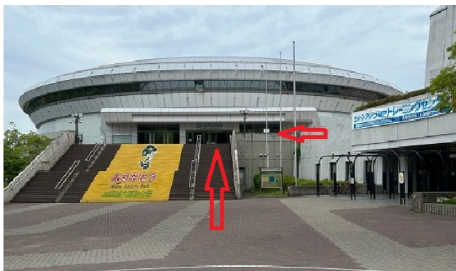
写真正面メインアリーナ、右サブアリーナ。

大会当日の受付場所は、「グリーンアリーナ神戸」の2階正面玄関を入った所で行なっています。